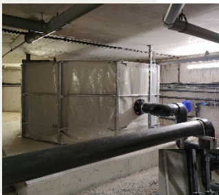
Dans les coulisses du centre nautique.

Le renouvellement de l'eau des bassins dans une piscine publique est une obligation réglementaire ; il est calculé quotidiennement en fonction du nombre de baigneurs. Le nouveau dispositif fonctionnera avec une intelligence artificielle pour calculer très précisément l'eau à renouveler. La chaleur de l'eau évacuée sera réutilisée pour préchauffer l'apport d'eau quotidien, réduisant la consommation énergétique du bâtiment.